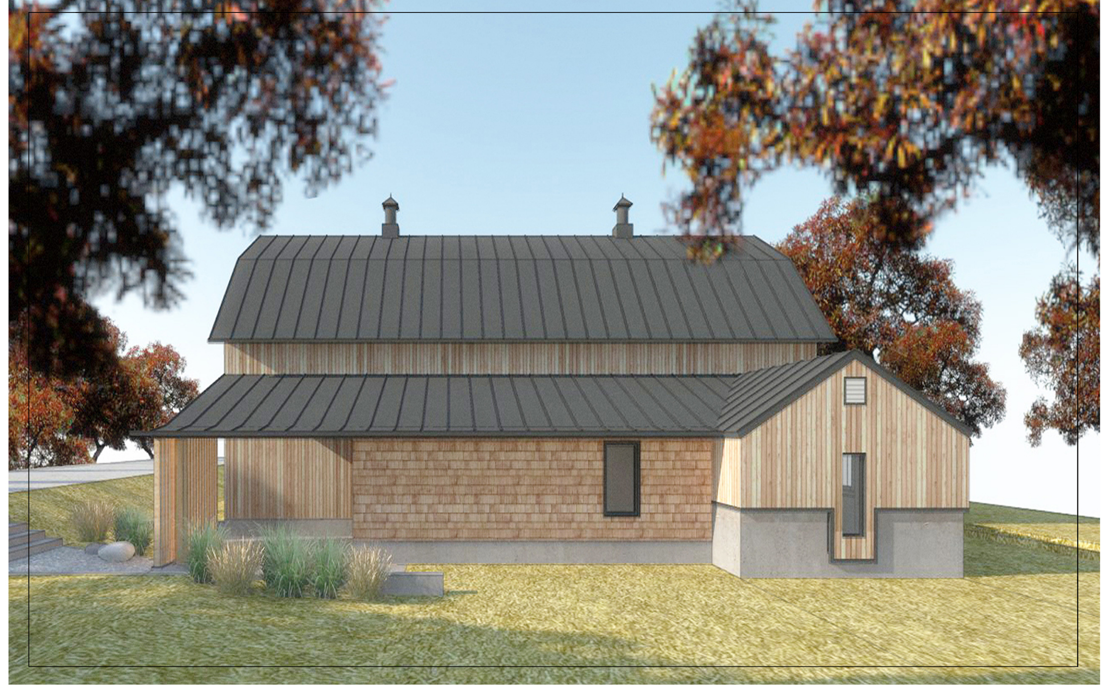
La façade arrière