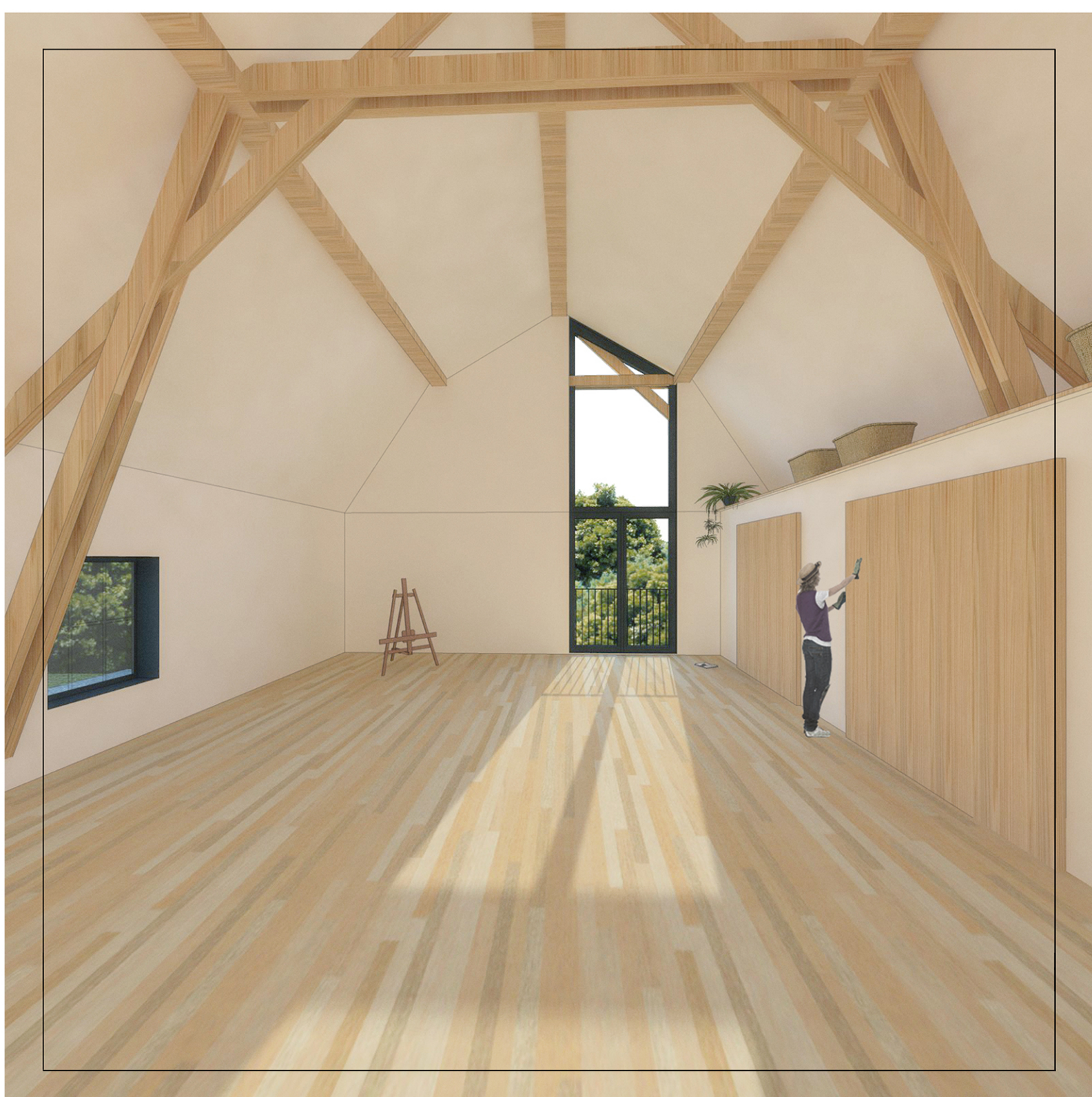
L'atelier de l'étage