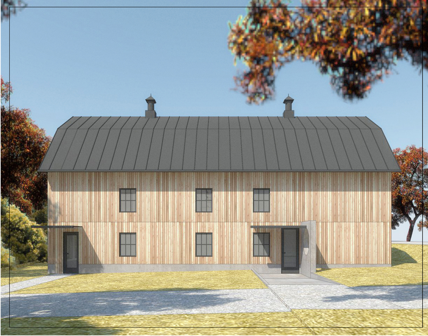
La façade principale

Équipe eba: Elisabeth Bouchard, Eric Boucher, Trisha Brown Architecte paysagiste: Emmanuelle Tittley Ingénieur structure: CTD