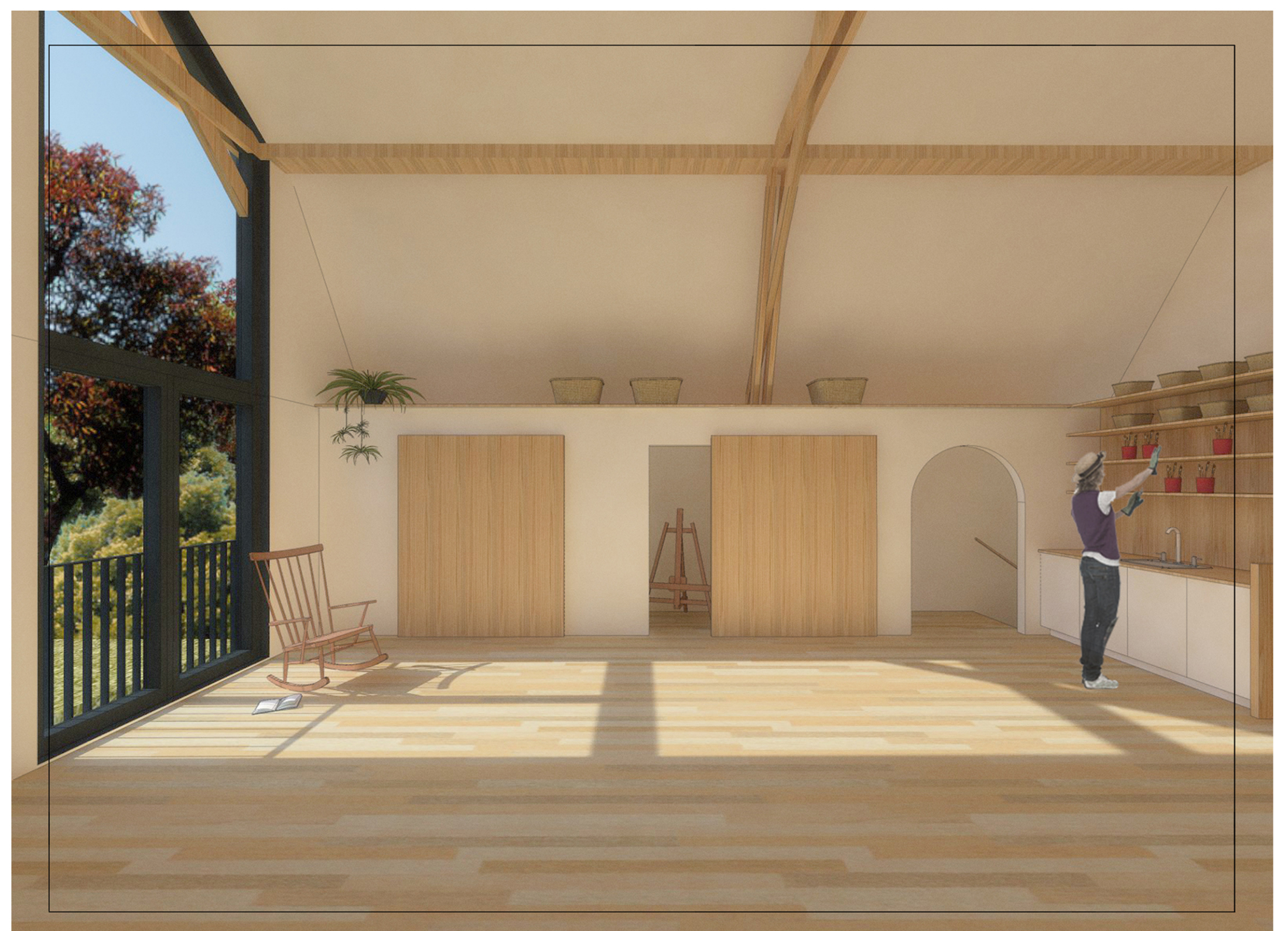
L'atelier de l'étage ouvert sur le ruisseau